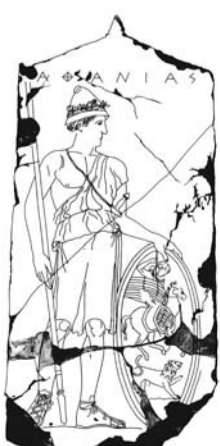
• Una de las piezas recuperadas por Grecia.