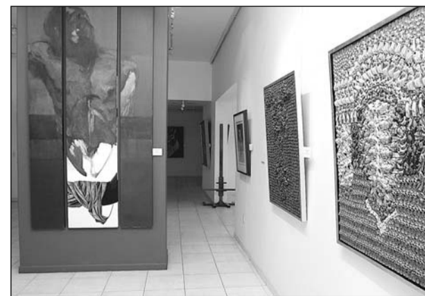
• Galería Vértice presenta la obra de medio centenar de reconocidos artistas en Exposición de verano .