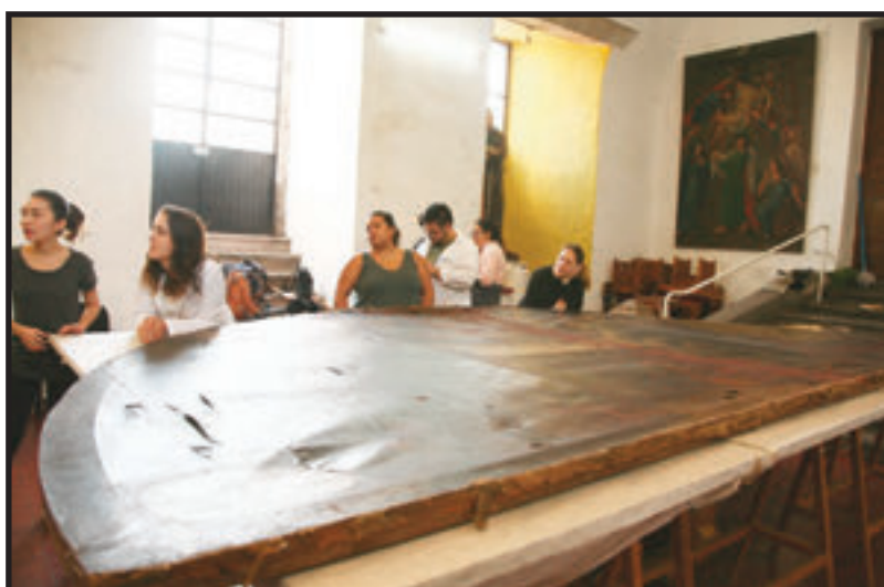
ESTUDIANTES DE GUADALAJARA APLICARON SUS CONOCIMIENTOS EN CAMPO.