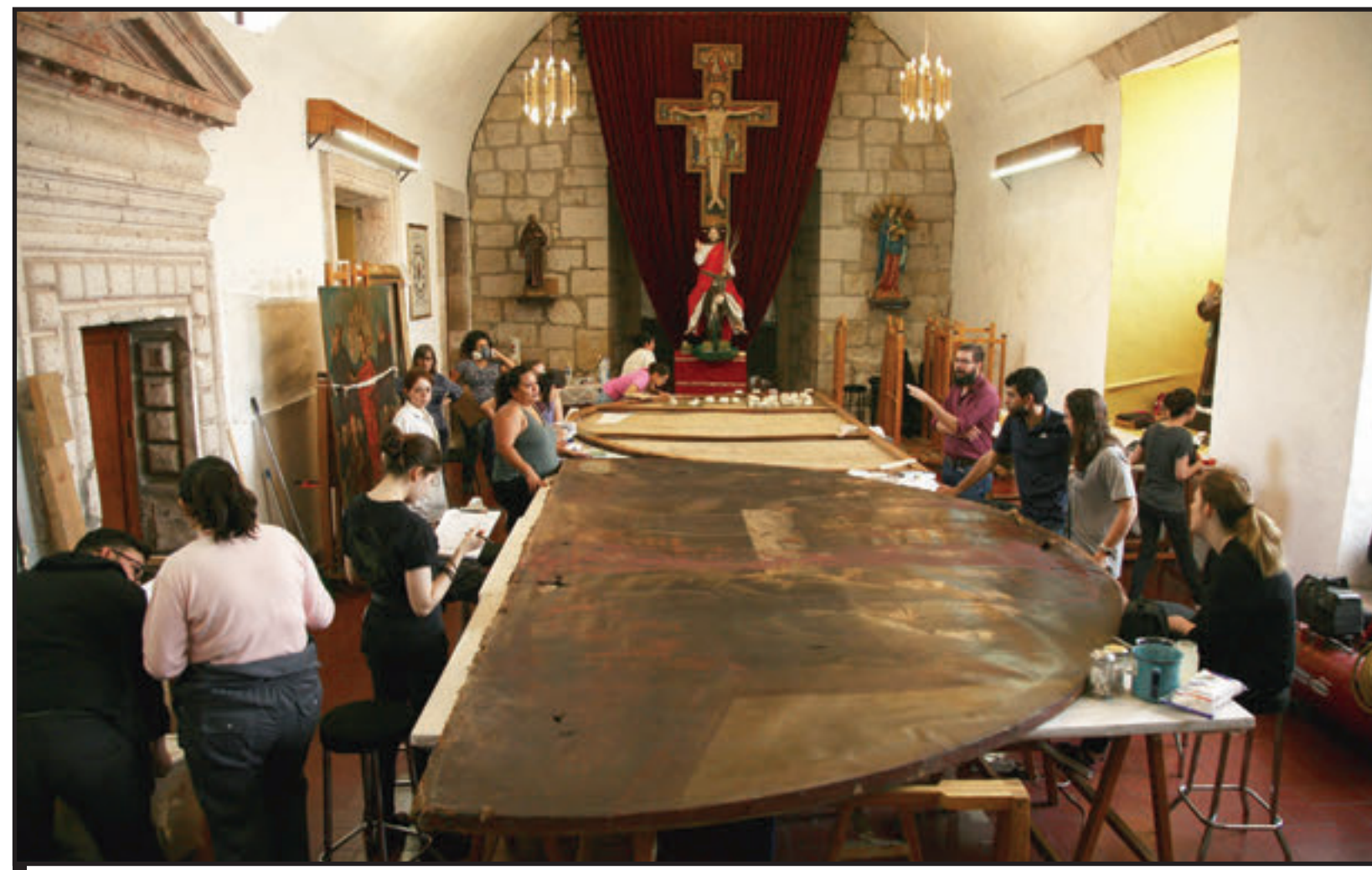
DURANTE CASI UN MES ESTUDIANTES DE LA ESCUELA DE CONSERVACIÓN Y RESTAURACIÓN DE OCCIDENTE ESTUVIERON TRABAJANDO EN TRES OBRAS DE ARTE SACRO.

Detalló que se montó el taller de trabajo en el salón anexo a la sacristía de templo de San Francisco con el ob-