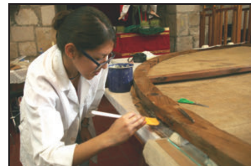
LOS MATERIALES FUERON PREVIAMENTE ANALIZADOS PARA PODER CURARLOS.