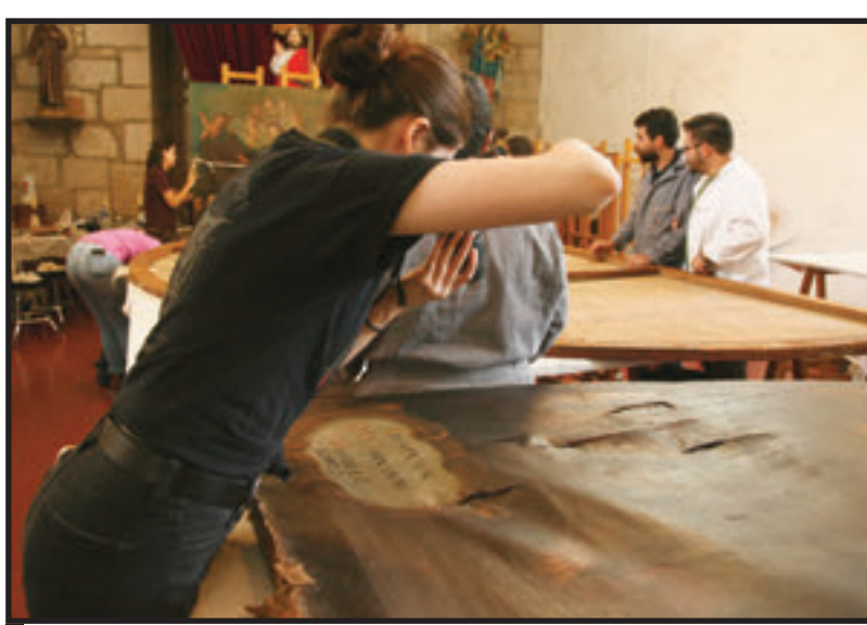
SE LLEVARON BITÁCORAS DE TRABAJO DE CADA TRATAMIENTO DESARROLLADO.