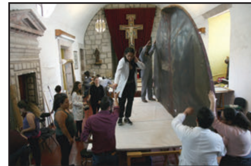
CUADROS SE ENCONTRABAN GUARDADOS, SE ESPERA QUE SE EXHIBAN EN BREVE.