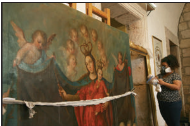
LOS ESTUDIANTES SE DIVIDIERON EN GRUPOS PARA ATENDER TODAS LAS PIEZAS.