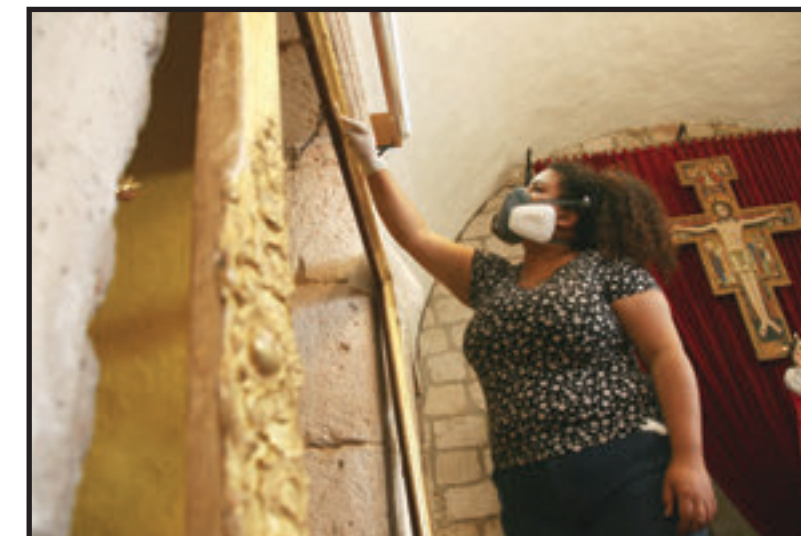
LA ARQUIDIOCESIS DE MORELIA ABRIÓ LAS PUERTAS A LOS CURADORES DE ECRO.